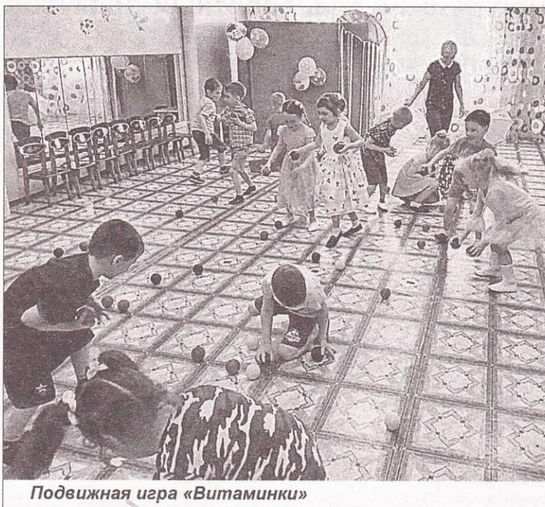
Подвижная игра «Витаминки»

Хочется рассказать еще об одном празднике, организованном воспитателями для всех ребят сада. Спортивное развлечение «Здравствуй, лето» началось с веселых стихов о лете, отдыхе, спорте, здоровье, которые выразительно рассказывали дошколята. В веселых эстафетах «Нарисуй солнышко», «Посади цветы», «Перепрыгни через лужи» не было проигравших, победила дружба! Подвижные игры под музыкальное сопровождение «Солнышко и дождик», «Витаминки», «Танец-игра», «Это я!» доставили удовольствие, радость и хорошее настроение всем без исключения. В конце праздника все ребята дружно