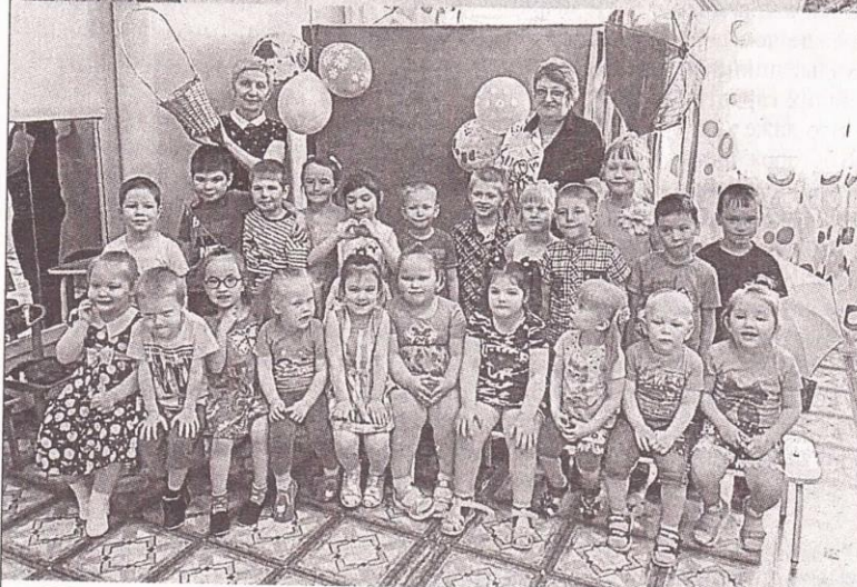
Шашечный турнир (фото сверху), Спортивный праздник (фото снизу)

Педагоги детского сада организовали работу так, чтобы детская деятельность в большинстве случаев проходила на открытом воздухе. Экскурсии, наблюдения, подвижные игры, игры-эксперименты, прогулки, физкультурный и музыкальный досуг соответствовали тематическому планированию проекта на июнь: «Здравствуй лето», «Осторожный пешеход», «Здоровому – все здорово», «Юный эколог». Развивающая предметно-пространственная среда групп пополнилась новыми играми: «Цветочный магазин», «Дорожная азбука», «Ходят капельки по кругу»; пособиями «Строение человека», «Витаминный салат»; «Необычные Шапки»; плакатами «Лекарственные растения», «Полезные и вредные продукты». Непрерывная работа велась и с родителями воспитанников. Для них в июне оформлены два стенда с полезной информацией «У каждого ребенка есть права», «Детство – чудная пора» и с детскими работами (рисунками, аппликациями, пластилинографией). Консультативный материал по темам организации летнего отдыха, оздоровления и правильного питания размещен и в родительских уголках всех групп детского сада.