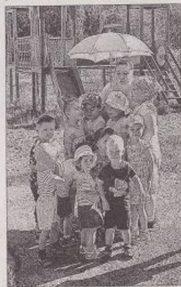
(Описание по стр. 4-5)